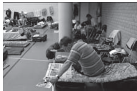
Een van de slaapzalen van de Ganzenheuvel