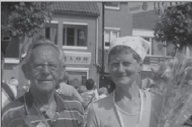
Tjeu's Kennedymars 21