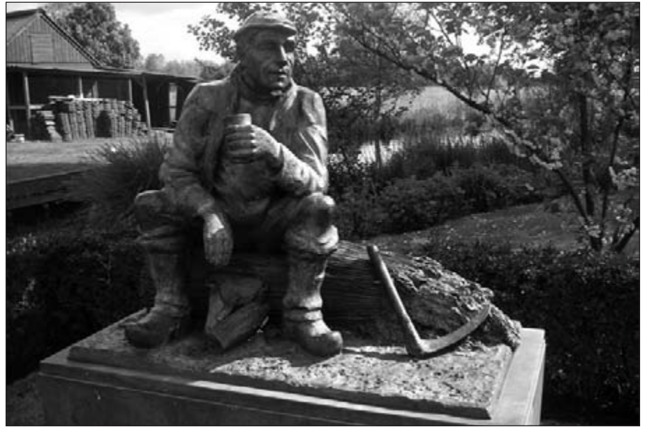
Beeld van de 'Rietwerker'

In Spanga, waar een ooievaarscentrum is, drink ik koffie in een cafe/ buurt huis met antieke koffiemolens, rommelig maar gezellig. Een tandem staat te koop in het invaliden-damestoilet.