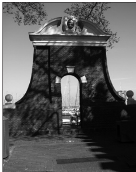
Het 'Specerijenpoortje' in Enkhuizen

Na de Roode klif en het J.L. Hooglandgemaal staan bij de sluis de beste stuurliu aan wal. Het leedvermaak is groot vanaf de veilige wal, neerkijkend op de onhandige pleziervaartschippers. Ik laat mijn rugzak achter in een cafeetje (een beproefde methode) want er is nog tijd om rond te kijken in Stavoren voor de boot vertrekt. Veel bijzonders is er