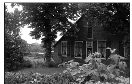
Boerderij in Blaricum

Ik gok erop dat de pont vaart, en dat doet hij, met uitzondering van zondagen. Het pad buigt bij Eemdijk weer af naar de dijk waar je bij doorgangen nog kunt zien hoe daar vroeger schuiven in konden worden geplaatst. Langs de oevers van het Eemmeer gaat het richting Spakenburg. Er is een bruidspaar voor een fotoreportage aan de haven, een paar dames in klederdracht, een museum, een rommelmarkt en een dijk die opnieuw langs het water leidt, nu Nijkerkernauw genaamd. Er staat een monument op de dijk met informatie over de overstromingen van vroeger. Als ik aan een man met verrekijker vraag waarom er zo weinig futenjon-