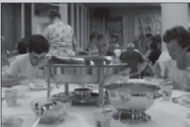
OLAT en de Vierdaagse 22-23