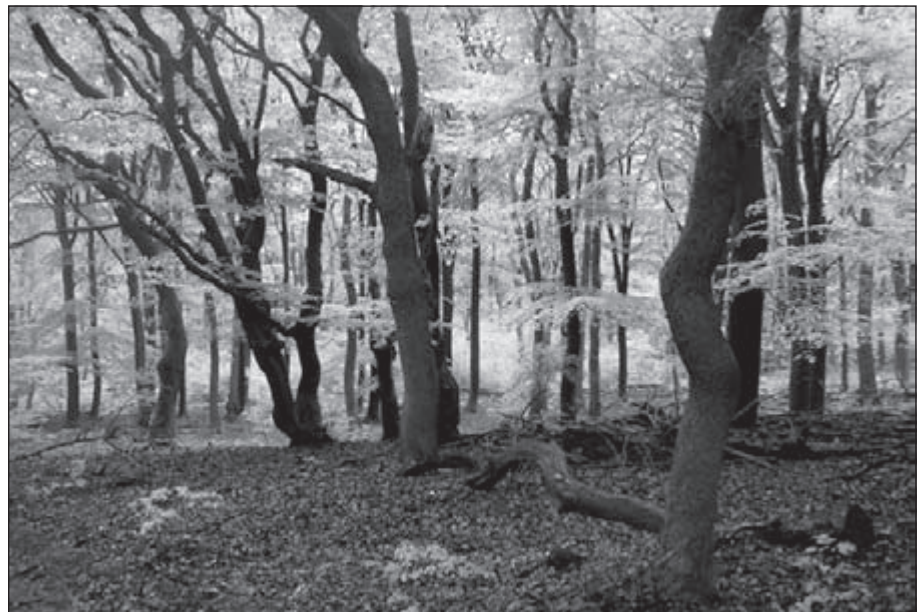
Dansende bomen tussen Koudhoorn en Nunspeet

avond. Tussendoor schijnt de zon, maar het waait flink en koud. Na Doornspijk ga ik de dijk op en kan genieten van grutto's en Kievieten die volop aan het baltsen en broeden zijn.