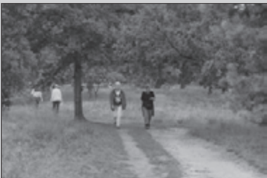
Kempische Wandeldagen 27-29

Prachtige luchten tijdens de Kempische Wandeldagen