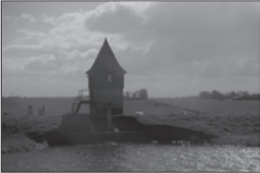
De geur van gras en water 11-15