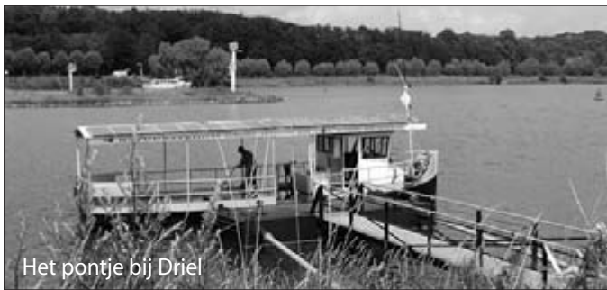
Het pontje bij Driel