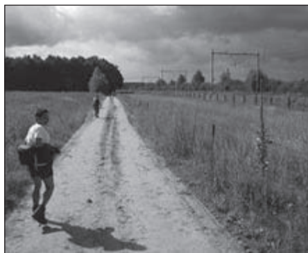
Het parkoers blijft wisselende beelden geven

We zijn een halfuurtje vroeger weg dan gisteren en dat mag ook wel want er wachten ons 36,695 kilometer. De eerste paar kilometer zijn net niet dezelfde als de aankomst van gisteren, zij het in omgekeerde richting uiteraard. Een kanaaltje, achter de imposante kerk door, langs de rivier (de Dommel?) en reeds na 4,3 kilometer naast de spoorweg de eerste, nog zeer drukke, rust.