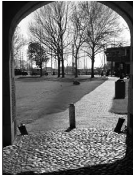
Onder de 'Drommedaris' in Enkhuizen

Tijdens de slag bij Warns, ging het er in 1345 warm aan toe, maar de Friezen wonnen (toen) van de Hollandse graven onder leiding van Willem IV. Nog jaarlijks wordt die overwinning gevierd, waarbij het behoud van de Friese taal, cultuur en identiteit centraal staat. Op de dijk bij Laaksum staat een monument