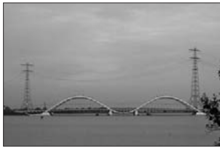
Brug naar de nieuwe wijk IJburg

Het Diemerpark is aangelegd op een van de meest vervuilde plekken in Nederland. Er zijn drastische maatregelen getroffen tegen giflekage en alles ziet er groots en nieuw en onwennig uit. Waarschijnlijk zal dit park in de komende jaren uitgroeien tot een mooi recreatiegebied voor de nieuwe wijk IJburg die volop in aanbouw is. Ik geniet van de aalscholvers en reigers en wilde bloemen. Bij Muideren staat een indrukwekkend fort en het Muiderenslot, onderdeel van de stelling van Amsterdam, voor de kust is een glimp van Pampus zichtbaar. Bij de sluis in de Vecht, in het cafe van Ome Ko, is de koffie goed sterk, zodat ik er weer tegenaan kan op de dijk met zicht op het nieuwe land: de torens van Almere kun